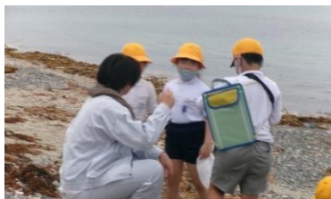
2年 大津緑洋高の生徒さんと交流

3年生は、長門市内（市役所、棚田、千畳敷、湯本）をバスでめぐりました。長門市のすてきをいっぱい発見しました。