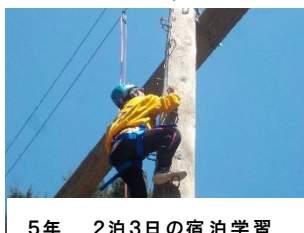
5年 2泊3日の宿泊学習