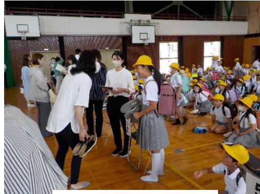
「引き渡し訓練」から

授業参観での子どもたちの様子はいかがだったでしょうか。みなさんのお力を借りながら、子どもたちは少しずつ成長しています。ありがとうございます。