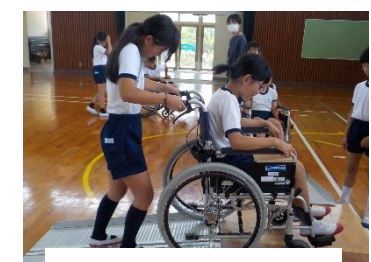
4年 福祉「車いす」体験

地域や保護者の方には、2年生まちたんけん、3年生自転車教室、4年生の図画工作科、6年生家庭科、そして、朝の交通指導、読み聞かせ、下校の見守り、草取り等、見守りや支援をしてくださり、本当にありがとうございます。たくさんの応援をいただき、「こだま」がどんどん広がっています。