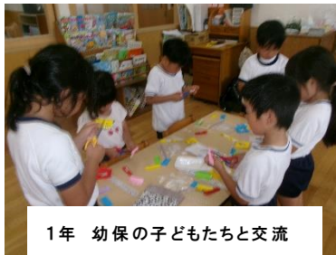
1年 幼保の子どもたちと交流

学校にとっても、地域にとっても、それぞれに「いい風」が吹く「こだま」がいっぱいの仙崎小でありたいと思います。