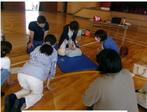
「救命救急法講習会」から