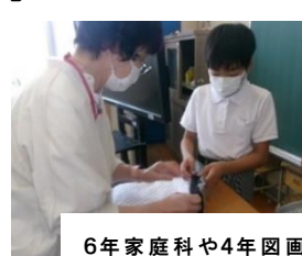
6年家庭科や4年図画工作科を地域の方が支援