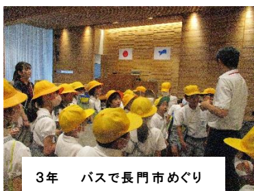
3年 バスで長門市めぐり

5年生は、2泊3日で、十種ヶ峰青少年自然の家で、様々なチャレンジ体験をしました。これからの学校生活が楽しみです。また、JAさんにご指導いただき、バケツ稲づくりを始めました。