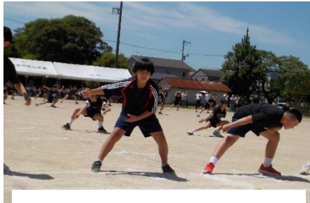
5・6年生 団体演技 「仙小ソーラン ～春の舞～」