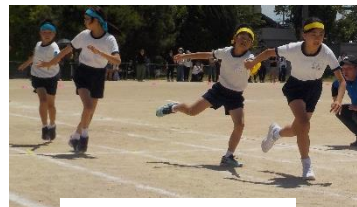
白熱した選手リレー