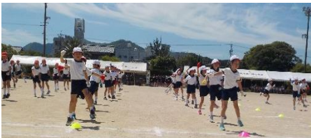
1・2年生 団体演技「学園天国!!!」