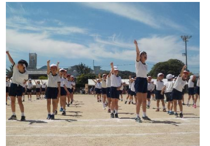
全力を出し切った、白組・赤組の応援合戦