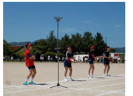
全力を出し切った、白組・赤組の応援合戦