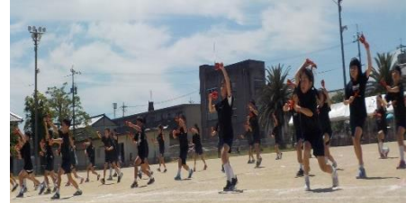
3・4年生 団体演技「仙小『唱』time!!!」

手伝うことはありませんか。」と中学生。改めて「仙崎パワー」のすごさを実感した運動会です。みなさんのおかげで、無事運動会を終えることができました。ありがとうございました。来年度もお待ちしています。