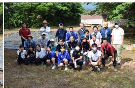
最後にみんなで「はい、チーズ！」