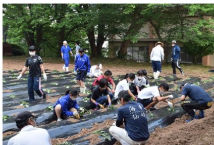
苗植え「意外と難しいな～」