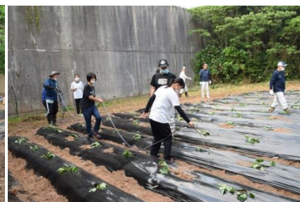
水やり「大きく育ってね！」